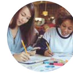
Projetos Educacionais e Psicopedagogia