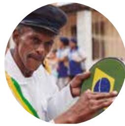
Cultura, Defesa e Conservação do Patrimônio Histórico e Artístico