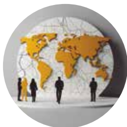
Relações e Crises Institucionais