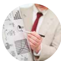
Geopolítica e Gestão de Crises