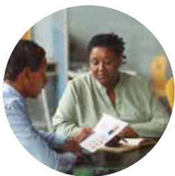
Educação e Capacitação Corporativa

O SAGRES está qualificado como Organização da Sociedade Civil de Interesse Público (OSCIP), nos termos da Lei nº 9.790, de 23 de março de 1999, conforme despacho da Secretaria Nacional de Justiça, publicado no Diário Oficial de 15 de agosto de 2006.