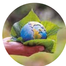
Defesa, Preservação e Conservação do Meio Ambiente e Promoção do Desenvolvimento Sustentável