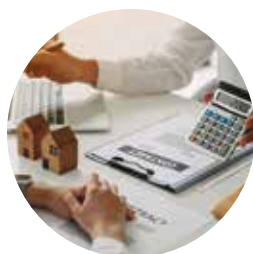
Financiamentos e Investimentos Estratégicos