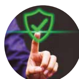
Segurança e Defesa