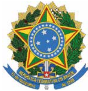
Ministério das Minas e Energia