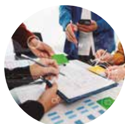
Prospecção Estratégica, Planejamento e Gestão