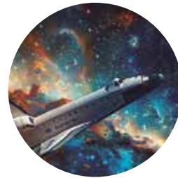
Aeronáutica e Espaço