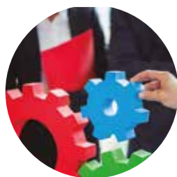
Desdobramento e Alinhamento, tático e operacional, da Estratégia Organizacional;