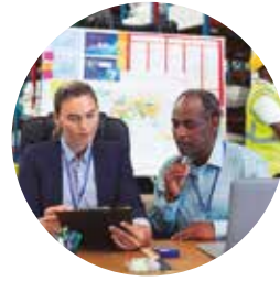
Logística e Gestão de Recursos