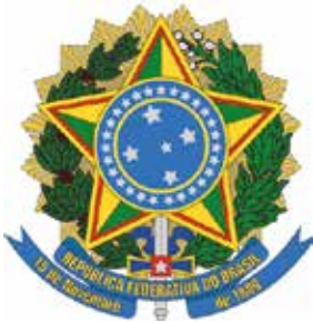
Ministério do Desenvolvimento Social