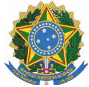
Ministério da Integração e do Desenvolvimento Regional