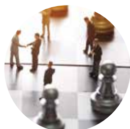
Política e Estratégia

Surgiu o Instituto SAGRES – Política e Gestão Estratégica Aplicadas, como associação de direito privado, sem fins lucrativos, com a finalidade de promover estudos e pesquisas, desenvolvimento de tecnologias alternativas, produção e divulgação de informações e conhecimentos técnicos e científicos, bem como eventos, consultorias, palestras e cursos de capacitação e desenvolvimento nas áreas de: