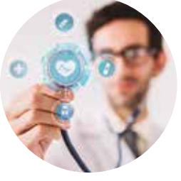
Gestão em Saúde