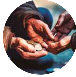
Promoção do Desenvolvimento Econômico e Social e Combate à Pobreza