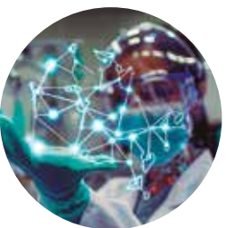
Ciência, Tecnologia e Inovação