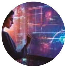
Governança e Compliance