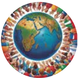
Promoção da Ética, da Paz, da Cidadania, dos Direitos Humanos, da Democracia e de outros Valores Universais