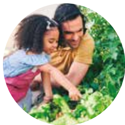
Agronegócio e Agricultura Familiar